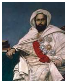
Emir ABD EL-KADER